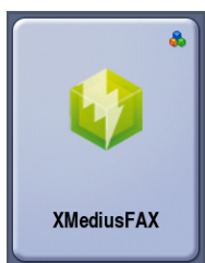
Écran de sélection du serveur de fax